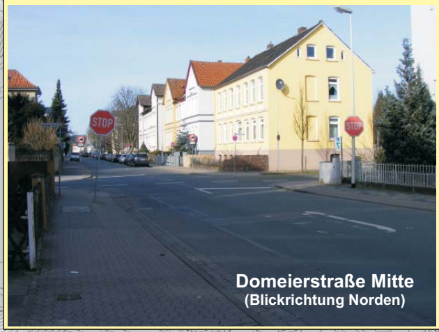
Domeierstraße Mitte (Blickrichtung Norden)