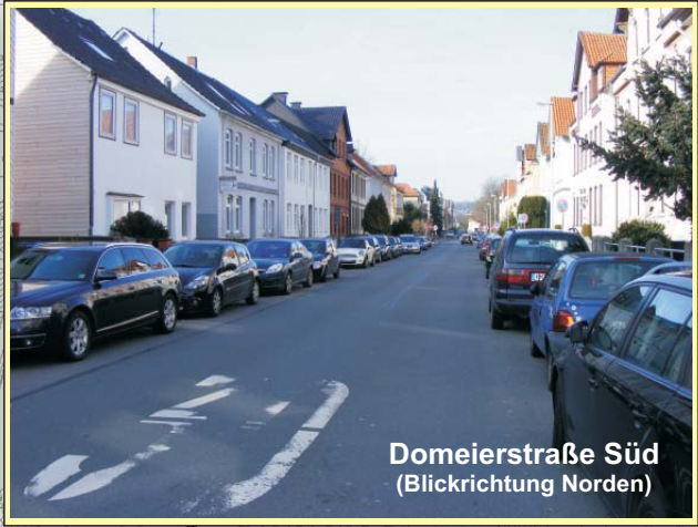
Domeierstraße Süd (Blickrichtung Norden)