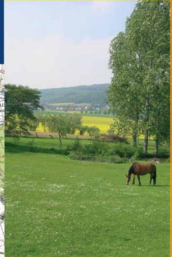
Hamel, Hessisch Oldendorf